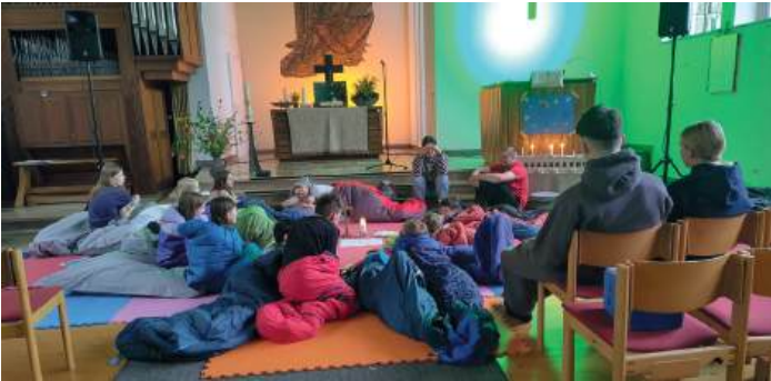
Zum Abschluss übernachteten die Konfikids in der Petruskirche

In der Apostel-Gesamtkirchengemeinde beginnt die Konfirmandenzeit bereits in der 4. Klasse. Die „Konfikids“ treffen sich zwischen September und Mai regelmäßig donnerstags in der Jakobus- und der