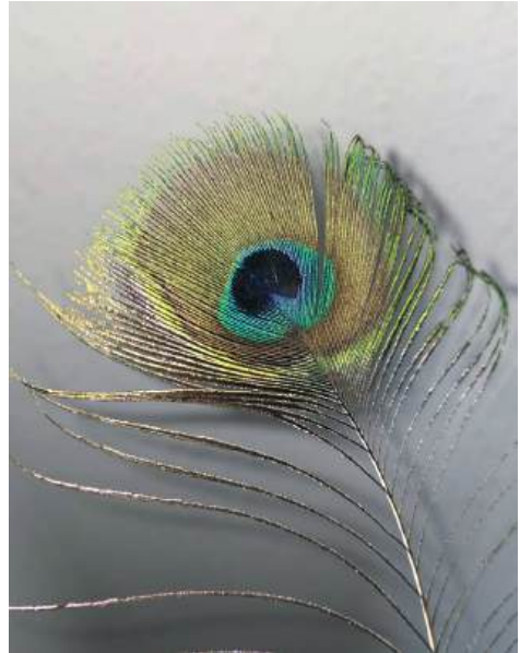
Grund zum Staunen

Denn: Staunen hat etwas mit Lebendig-sein zu tun!